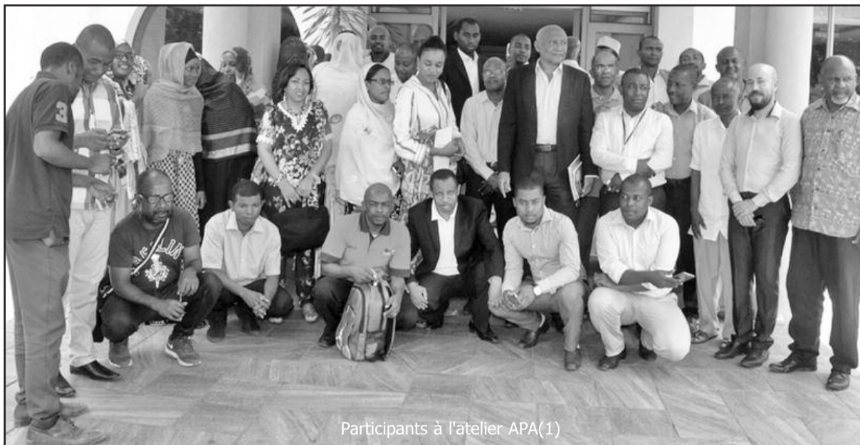
Participants à l'atelier APA(1)