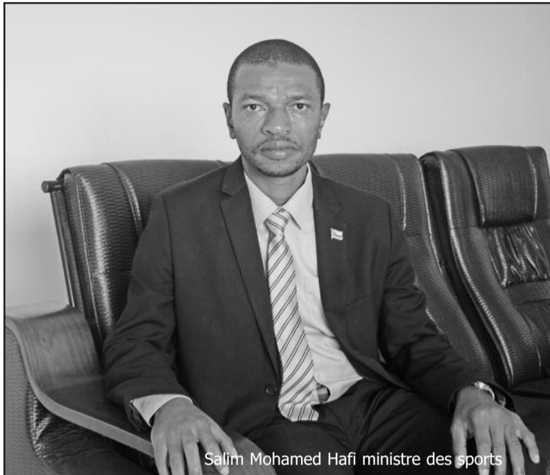
Salim Mohamed Hafi ministre des sports

Depuis un moment, une rivalité de compétences fait rage au sein du mouvement sportif national. Chacun campe sur sa position. Pire, on s'accuse les uns et les autres d'être à l'origine du conflit. Pour préserver la concorde et l'homogénéité, le Ministre des Sports, Mahmoud Salim Hafi, a pris le taureau par les cornes. Des mesures de suspension et d'harmonisation sont adressées aux organes du sport national. Mais, l'initiative fait grincer des dents.