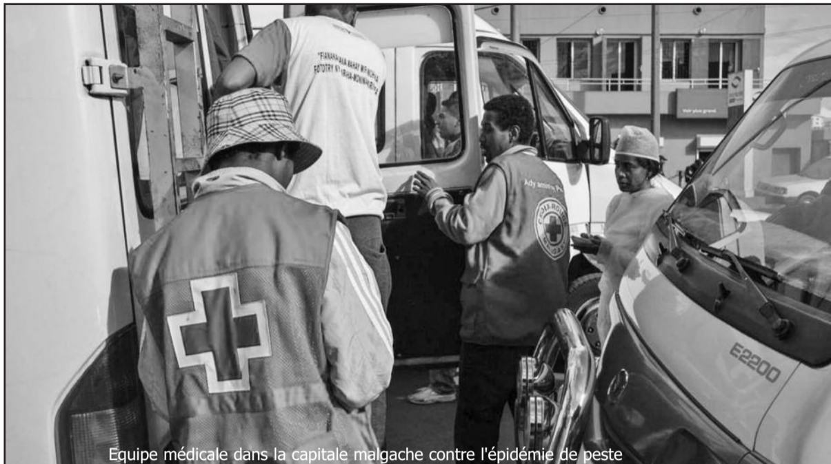
Equipe médicale dans la capitale malgache contre l'épidémie de peste

experts est complétée par des dons de matériels en appui à la direction de la veille sanitaire et de la surveillance épidémiologique du ministère de la santé de Madagascar. L'unité de veille sanitaire de la COI prévoit d'envoyer 200 équipements de protection individuelle de type 4 pré-positionnés dans les entrepôts de la Plateforme d'Intervention Régionale de l'Océan Indien (PIROI) de la Croix-