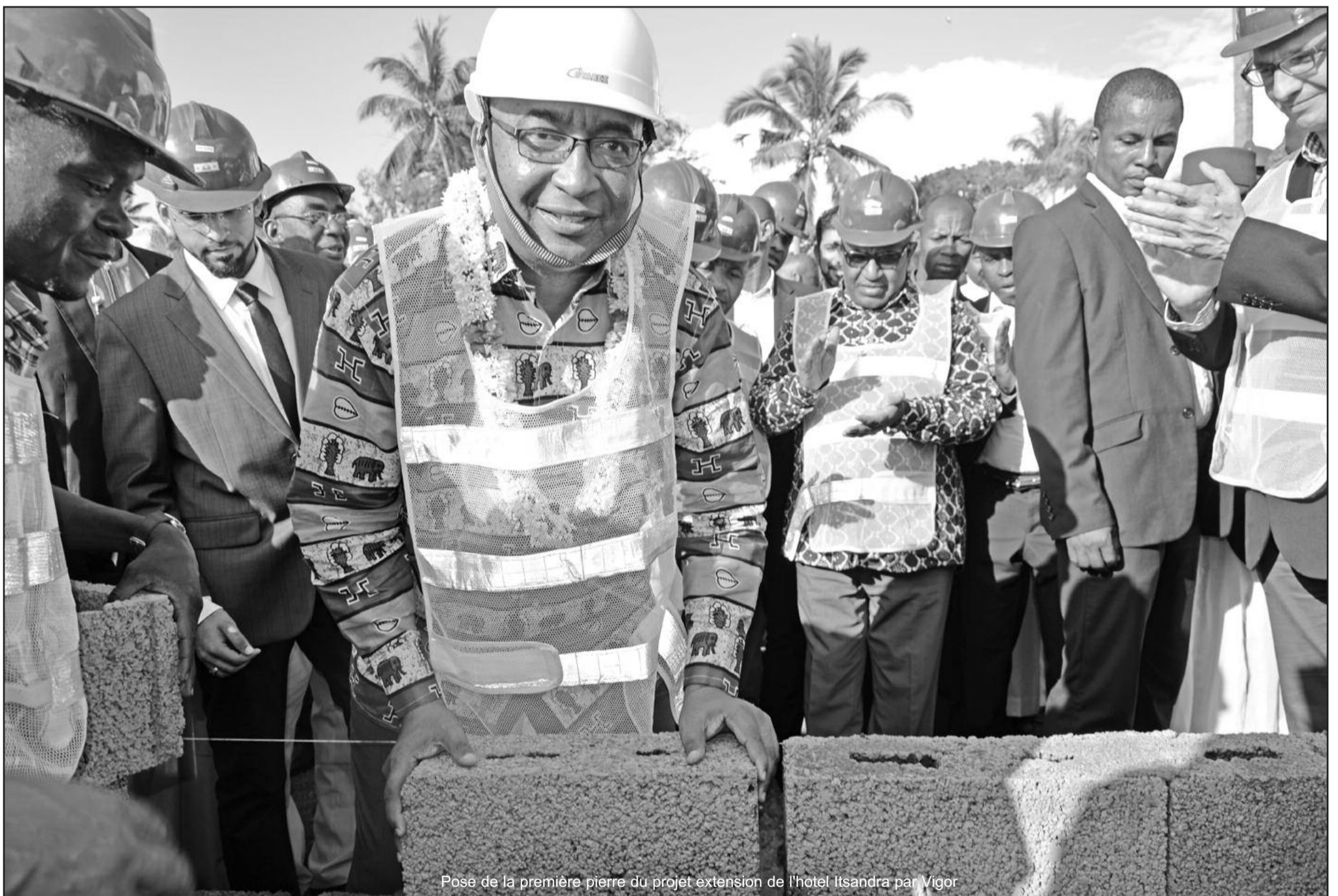
Pose de la première pierre du projet extension de l'hôtel Itsandra par Vigor