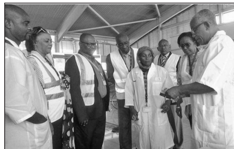
Remise de matériel et visite de contrôle à l'aéroport par la ministre de la santé